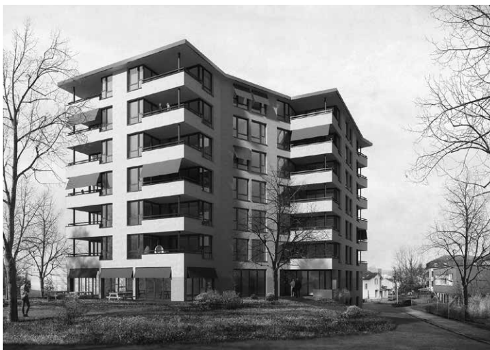
«Arbol» das Projekt des Zürcher Büros Baumberger & Stegmeier wurde einstimmig für die Weiterbearbeitung ausgewählt.

Am Tag bevor der Bundesrat mit der ausserordentlichen Lage die Schweiz stilllegte, wurde am 16. März die Jurierung des Projektes Talstrasse abgeschlossen. Der Vorschlag des Zürcher Büros Baumberger & Stegmeier wurde einstimmig für die Weiterarbeit ausgewählt. Im Sommer konnte die erste Sitzung der Baukommission abgehalten werden, seither finden diese in Form von Videokonferenzen statt. Für eine sehr visuell ausgerichtete Arbeit ist dies unbefriedigend, aber wir versuchen auf diese Weise nicht allzu viel Zeit zu verlieren. Das Vorprojekt ist abgeschlossen und das Projekt und der Kostenvoranschlag werden der kommenden Generalversammlung vorgelegt.